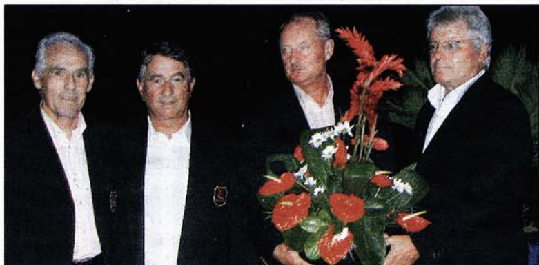
Golfparadies im Indischen Ozean, Abschluss, Option-Golf-Sieger (v.o.n.u.).