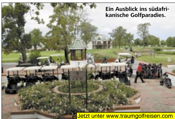
Ein Ausblick ins südafrikanische Golfparadies.