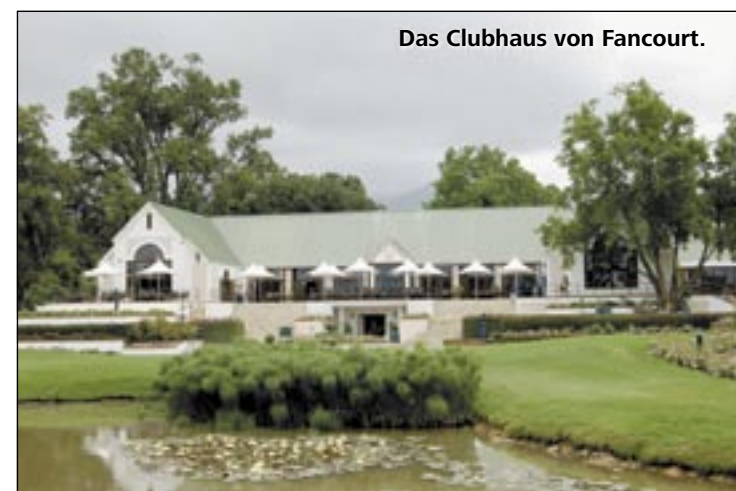
Das Clubhaus von Fancourt.

Die Elite-Anlage an der Garden Route bietet für die „professionelle“ Begleitung seiner golfenden Gäste mehrere hundert Caddies auf. Für die Pflege der vier Plätze und der gesamten Blütenpracht dieses wasserreichen Golf-Eldorados stehen 550 Mitarbeiter im Einsatz. Ein Personalaufwand, von dem Golfclubs in unsere Breitengraden nur träumen können.