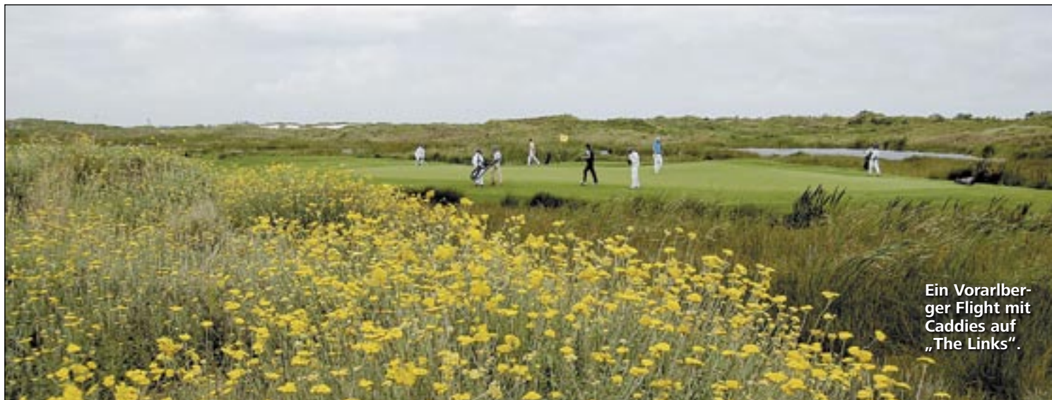
Ein Vorarlberger Flight mit Caddies auf „The Links“.